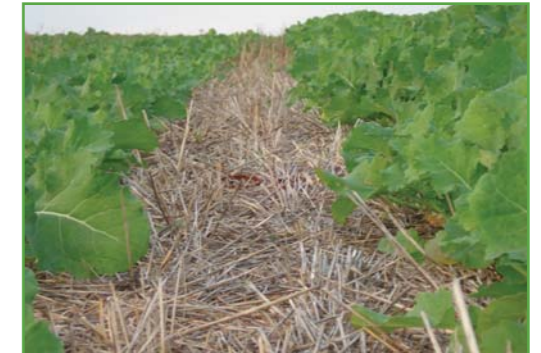
Озимий ріпак по No-till технології після озимої пшениці