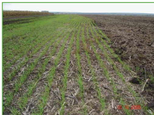
Якісний посів озимої пшениці по ріпаку (міжряддя не зруйновано, всі рослинні рештки залишено на поверхні ґрунту)

Бразильська компанія SEMEATO — світовий лідер із виготовлення сівалок для No-till. Упродовж 45 років SEMEATO розробляє «розумні» машини винятково для No-till, і це чітко відокремлює її з-поміж виробників, які спочатку виготовляли сівалки для традиційної технології, а згодом із ростом популярності та широким поширенням No-till у світі адаптували свої машини під цю технологію.