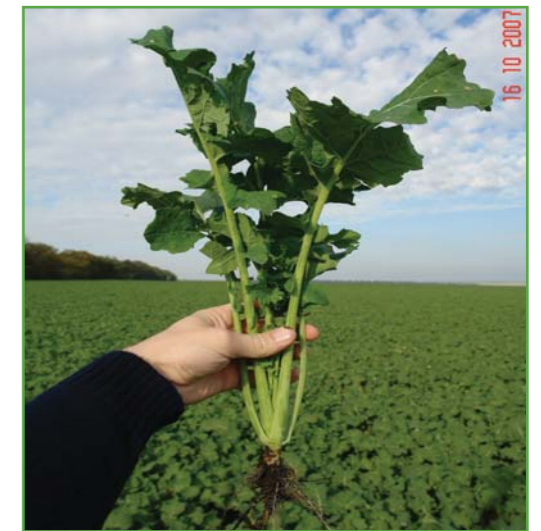
Розвиток озимого ріпаку по No-till