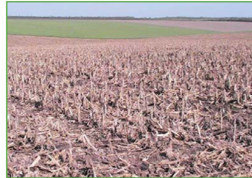
У такі рослинні рештки ми сіємо